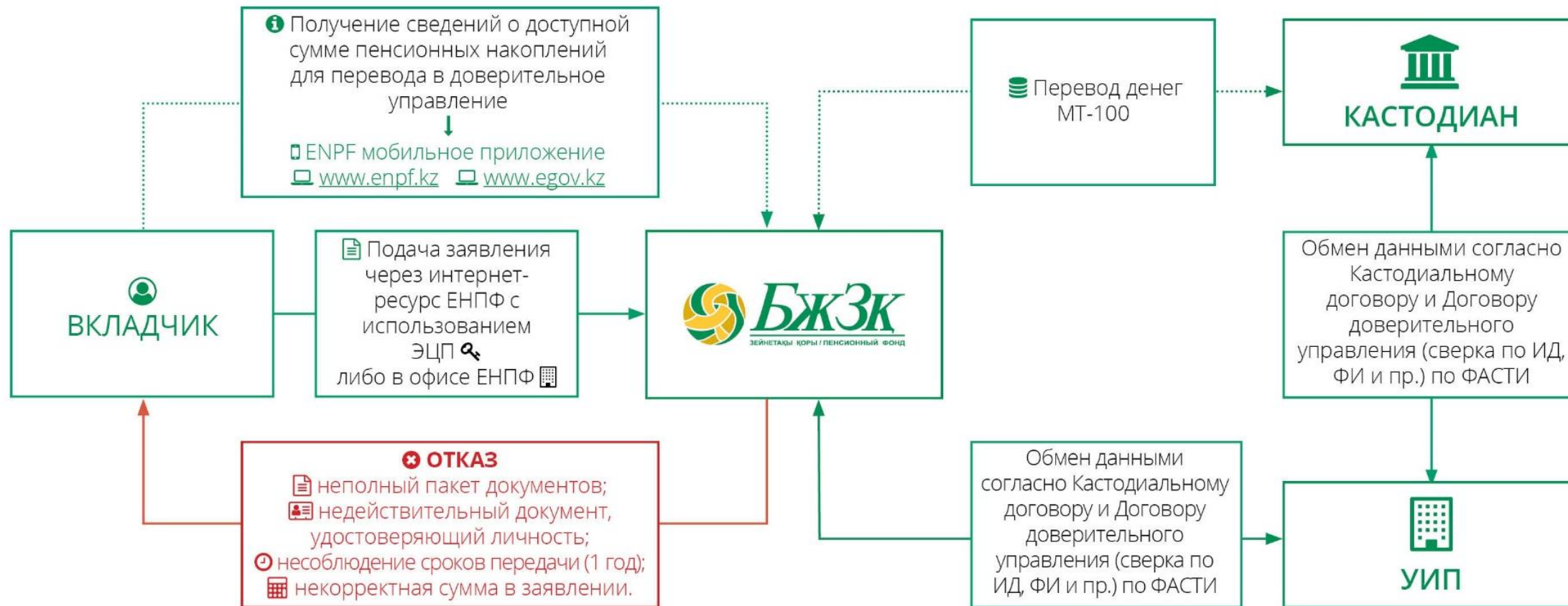
СХЕМА ПЕРЕВОДА ЧАСТИ ПЕНСИОННЫХ НАКОПЛЕНИЙ В ДОВЕРИТЕЛЬНОЕ УПРАВЛЕНИЕ (УИП)